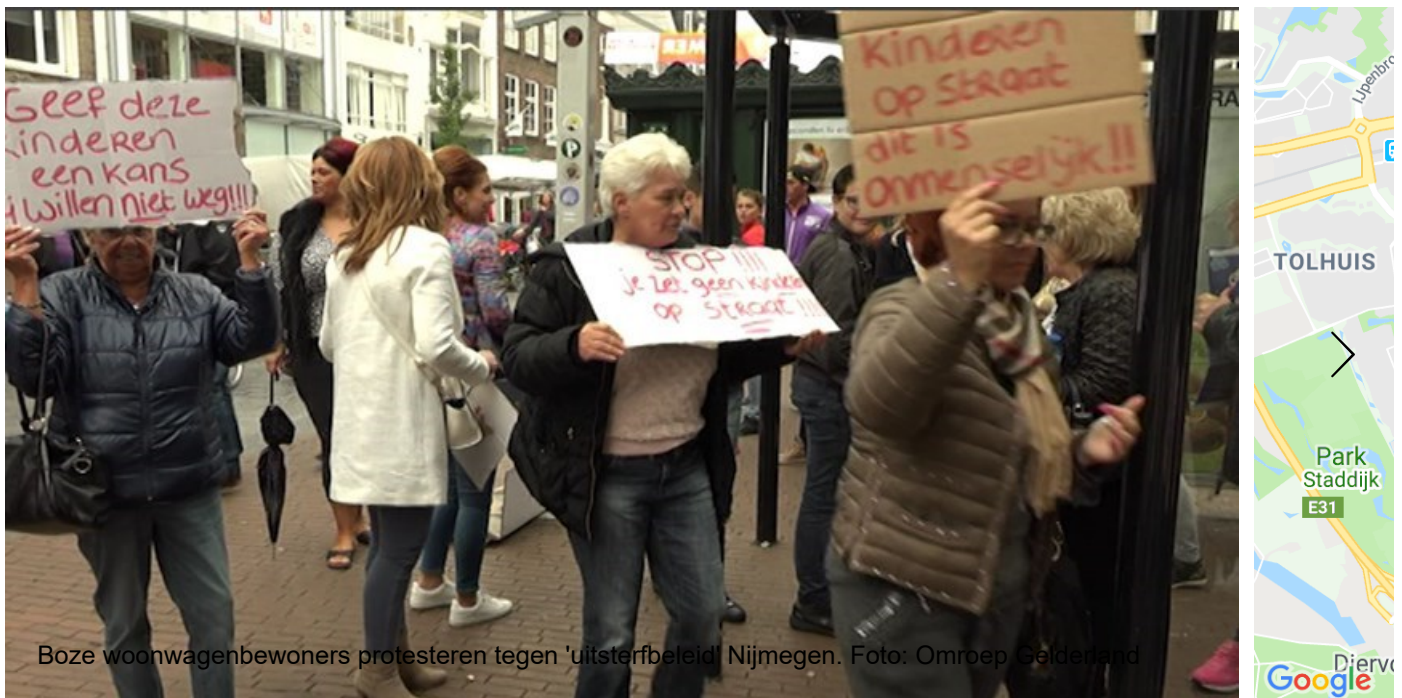
Boze woonwagenbewoners protesteren tegen 'uitsterfbeeld' Nijmegen.